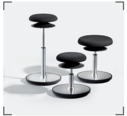
ERGO 1 und ERGO 2